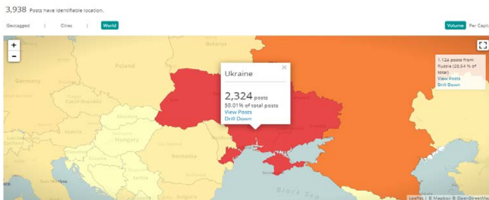
Рис.1. Географічний розподіл агресивних постів щодо кандидатів-чоловіків у пост-виборчий період (23-29.04.2019)

В цілому, за весь період моніторингу на кожний російський за походженням пост з агресивним контентом щодо жінок- політиків припадало 9 українських постів. Стосовно ж чоловіків-політиків ця пропорція складала 1 до 3,6. Отже, російські автори в мережах проявляли значно більшу агресію та насильство щодо представників політичного класу чоловічої статі. Це обумовлено чинником впливовості та шансами отримати останніми перемогу на виборах: найвпливовіші гравці притягували найбільшу увагу та викликали найвищу агресію.